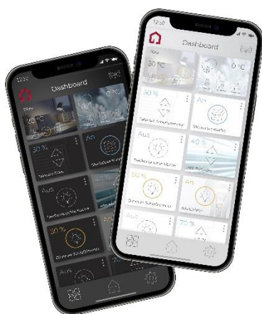
YOUVI Mobile App in dunklem und hellem Design