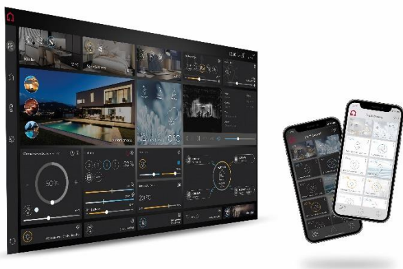
YOUVI 5.0 für Touchpanels und Smartphones

Bitte beachten Sie, dass diese Fotos nur zur Voransicht dienen. Für Ihre Publikationen nutzen Sie bitte die Fotos unter diesem Downloadlink .