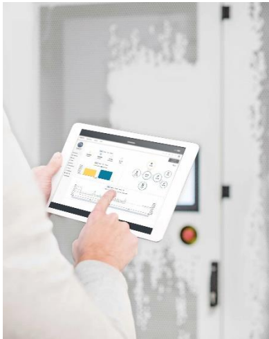
Nutzung von NTUITY über Tablet