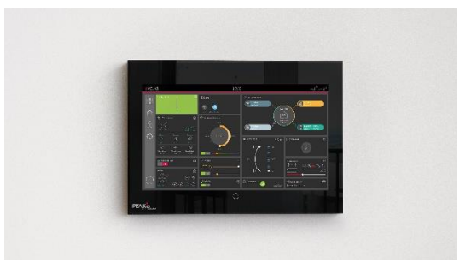
Abbildung des Energiemanagements über YOUVI