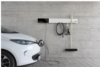
Station de recharge NTUITY