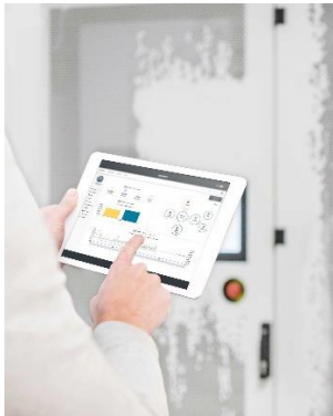
Utilisation de NTUITY sur tablette