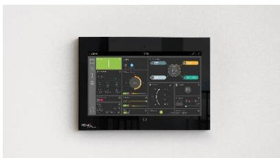
Représentation de la gestion de l'énergie via YOUVI

Veuillez noter que ces photos ne servent que de prévisualisation. Pour vos publications, veuillez utiliser les photos sous ce lien de téléchargement .