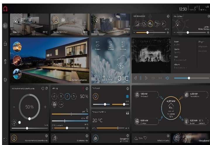
YOUVI 5.0 en design sombre