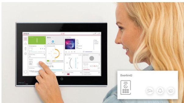
Erweitertes Türstationsmodul in der YOUVI Visualisierung