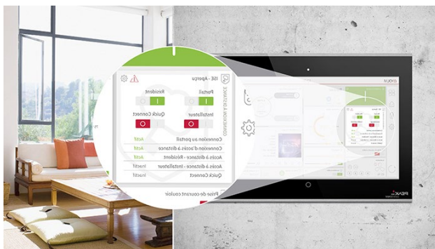
Volle Kontrolle über den Fernzugriff mit ISE Connect

Bitte beachten Sie, dass diese Fotos nur zur Voransicht dienen. Für Ihre Publikationen nutzen Sie bitte die Fotos unter diesem Downloadlink .