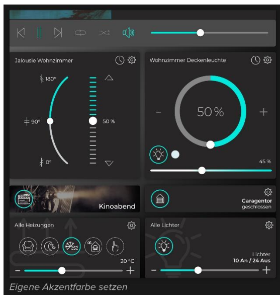
YOUVI 5.1: Möglichkeit der Wahl einer eigenen Akzentfarbe

Bitte beachten Sie, dass diese Fotos nur zur Voransicht dienen. Für Ihre Publikationen nutzen Sie bitte die Fotos unter diesem Downloadlink .