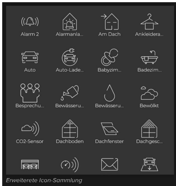
YOUVI 5.1: Erweiterte Icon-Sammlung