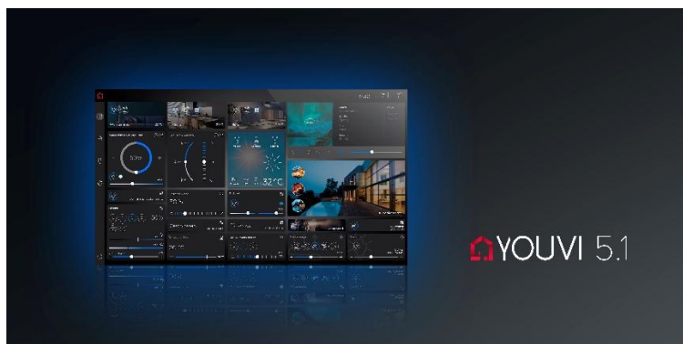
YOUVI 5.1: Akzentfarbe Blau